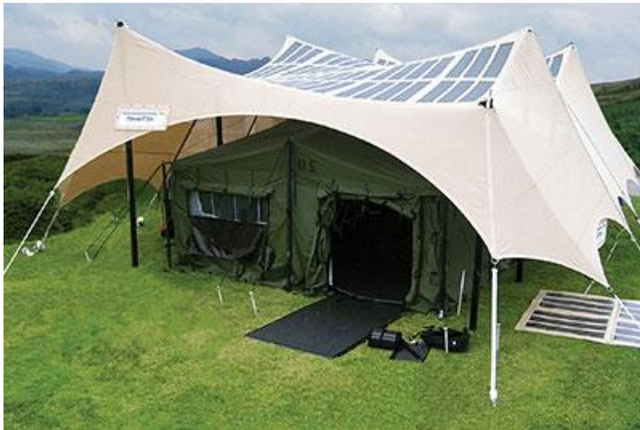
Ilustración 1 Tiendas de campaña con células fotovoltaicas